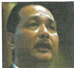
Dr Noor Hisham Abdullah