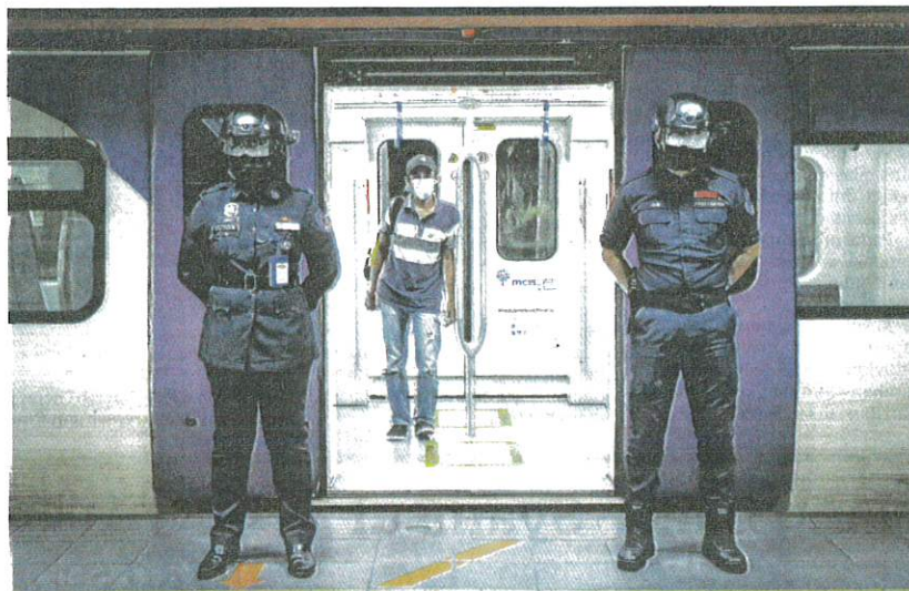
DUA anggota Polis Bantuan Keretapi Tanah Melayu Berhad menggunakan topi pengesan suhu badan untuk memeriksa suhu badan penumpang.

"Seterusnya, Tasik (empat), Benteng LD, Jalan Meru, Bah