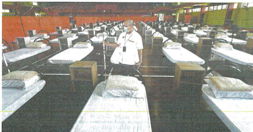
A Duchess of Kent Hospital official inspecting the beds set up at the Sandakan Sports Complex to be used as an additional Covid-19 ward in Sandakan yesterday.

"Meanwhile, four new deaths were reported to the Crisis Preparedness and Response Centre, and the death toll stood at 167 (one per cent of the cumulative cases)," he said.