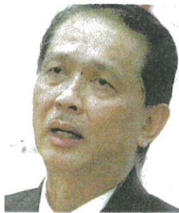
NOOR HISHAM ABDULLAH

Ketua Pengarah Kesihatan, Tan Sri Dr. Noor Hisham Abdullah berkata, kawasan Lembah Klang pula merangkumi 11.5 peratus daripada jumlah keselu-