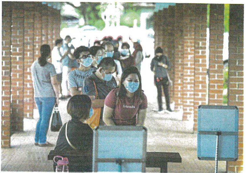
People queuing to undergo swab tests in Petaling Jaya yesterday.

nology chairman Datuk Ahmad Zaki Zahid said as pre-orders were already made by developed countries for at least 5.7 billion doses of Covid-19 vaccines, Malaysia was focusing on securing supplies that were safe and effective before addressing whether to make them available for free.