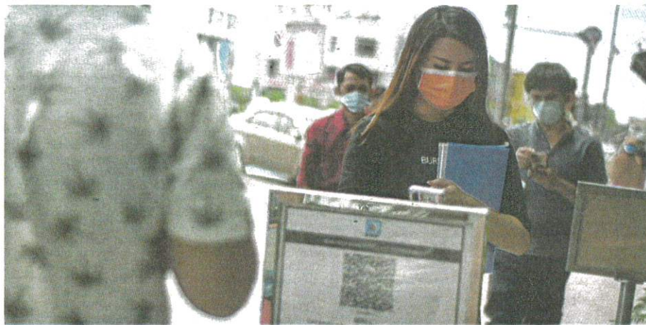
ORANG awam dilihat mematuhi prosedur operasi standard (SOP) dengan memakai pelitup muka di tempat awam sebagai langkah pencegahan Covid-19 ketika tinjauan di Bandar Hilir, Melaka, semalam.