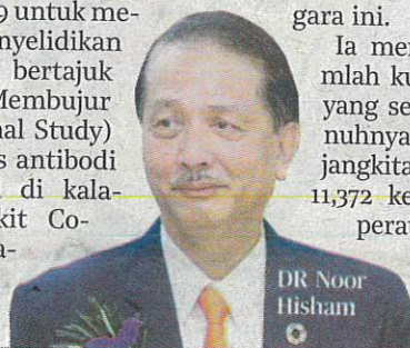
DR Noor Hisham

Ia menjadikan jumlah kumulatif kes yang sembuh sepenuhnya daripada jangkitan Covid-19 11,372 kes atau 67.4 peratus daripada jumlah keseluruhan kes.